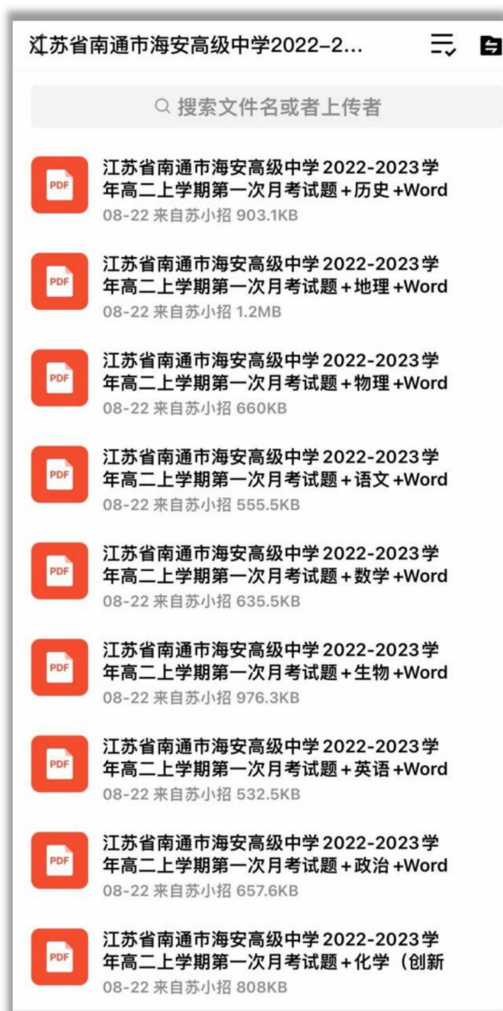
(招考网 qq 群资料)

如需第一时间获取相关资讯及备考指南，欢迎加入江苏招生考试网建立的【江苏高考交流群】，群内会分享一手高考资讯、往年真题、学习资料、综评、强基、志愿填报等干货及答疑，群内还有不定时福利发放哦，快加入吧！