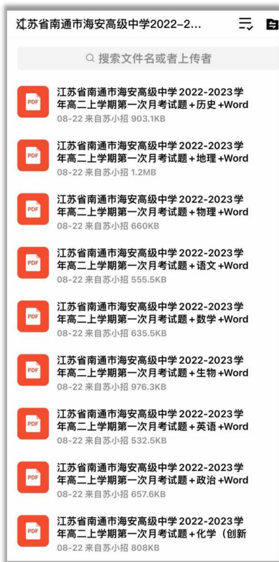
(招考网 qq 群资料)

如需第一时间获取相关资讯及备考指南，欢迎加入江苏招生考试网建立的【江苏高考交流群】，群内会分享一手高考资讯、往年真题、学习资料、综评、强基、志愿填报等干货及答疑，群内还有不定时福利发放哦，快加入吧！